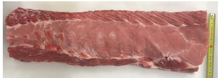
150-190 mm height