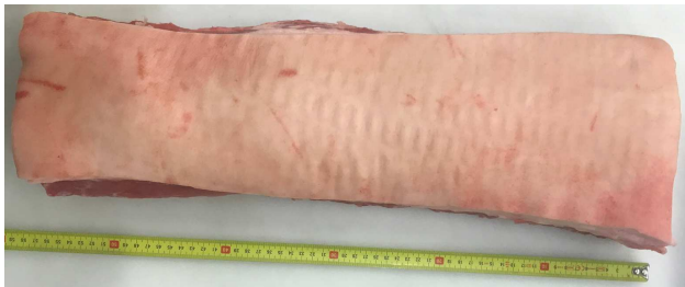
560-620 mm length