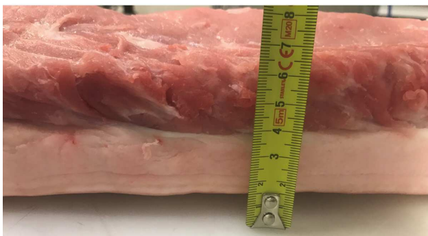
70-85 mm width